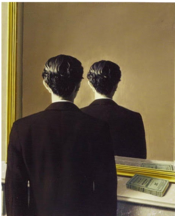
Rene Magritte, Zakazane oblicze